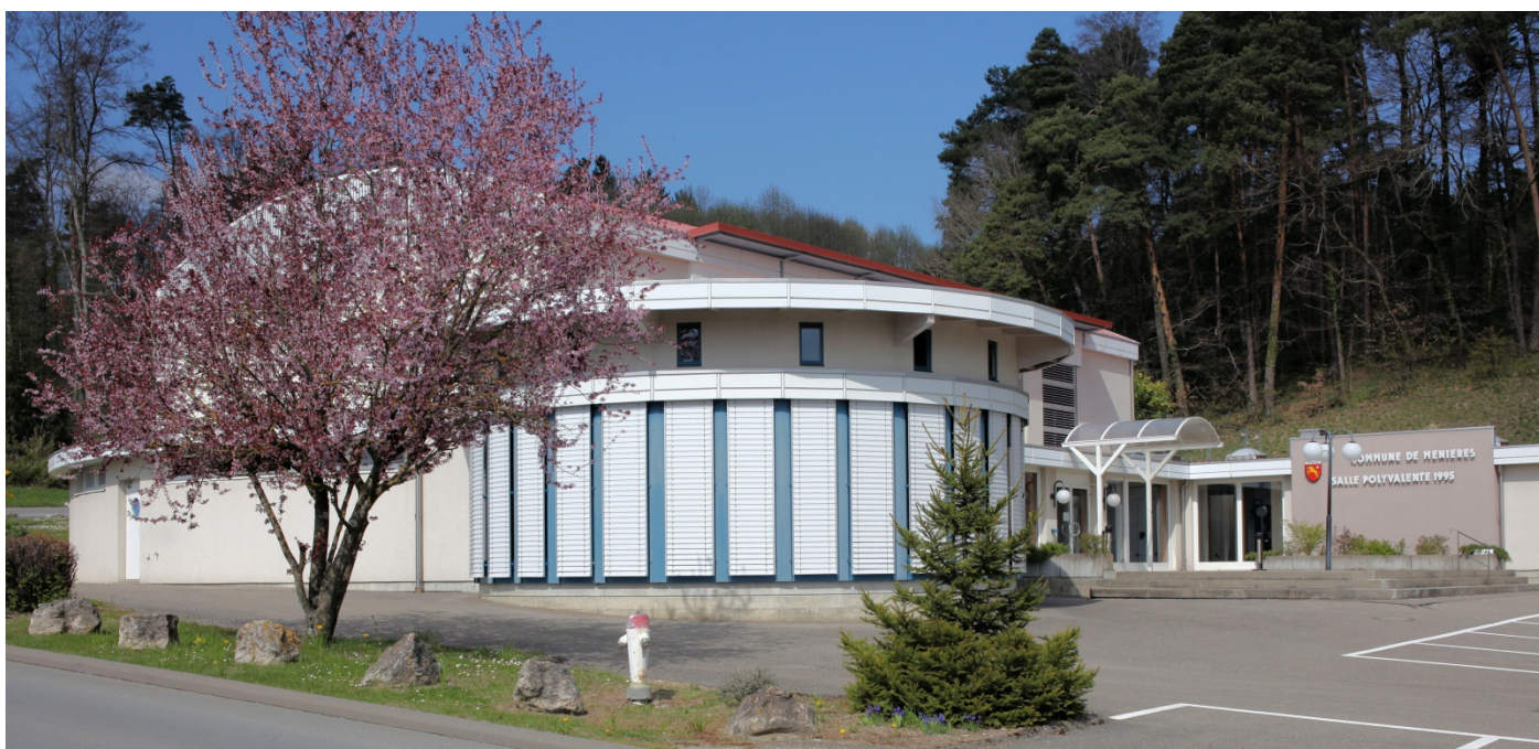
La Salle polyvalente de Ménières, 50 route de Vesin: grande salle, halle de sports, rotonde, spacieuse buvette, cuisine, parking. A disposition pour assemblées, mariages, anniversaires, lotos, gymnastique, danse, etc.