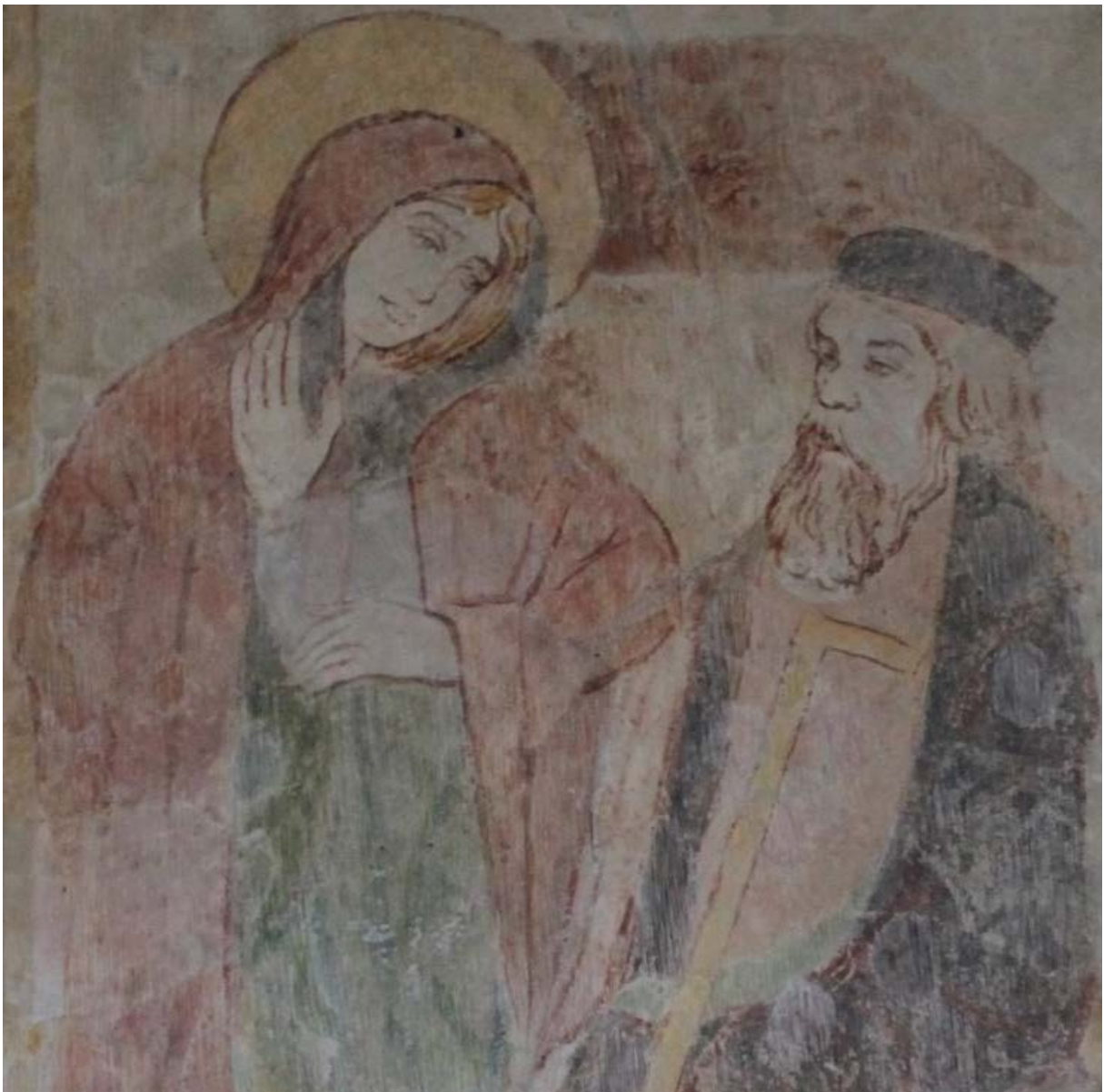
La Vierge annonce à Joseph qu'elle est enceinte. Fresques (XIVe siècle) de l'église de Ressudens (antérieure au XIIIe siècle)

Le Conseil communal vous souhaite de bonnes fêtes de Noël et une heureuse Nouvelle année!