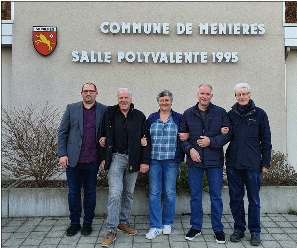
Le Conseil communal de Mènières 25 mars 2022