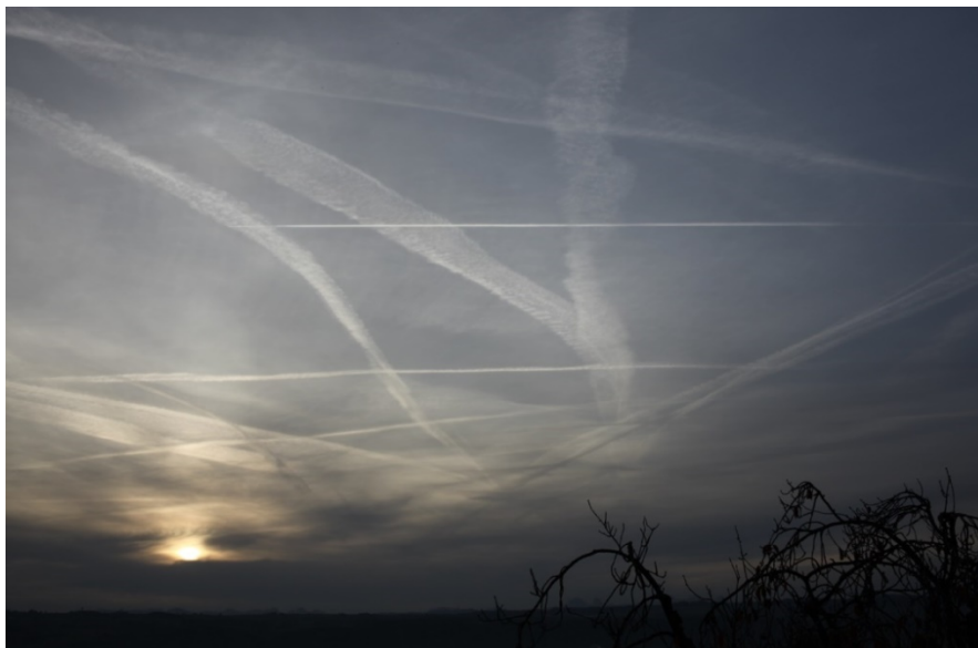
Le ciel de Ménières. Encore les paysans qui polluent du matin ...