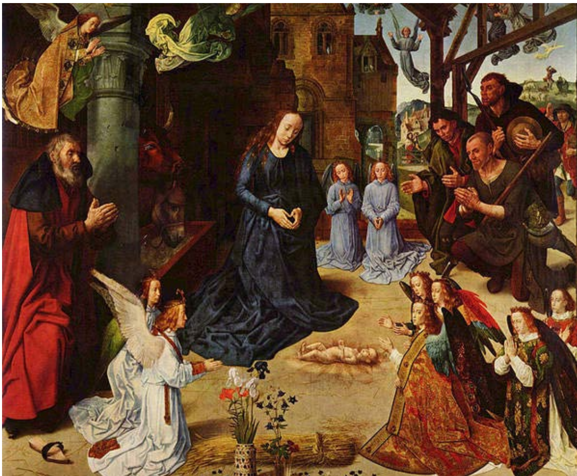
Hugo van der Goes (vers 1430/1440 - 1482), L'adoration des bergers (vers 1475).

Pièce centrale du triptyque Portinari. Florence, Galleria degli Uffizi.