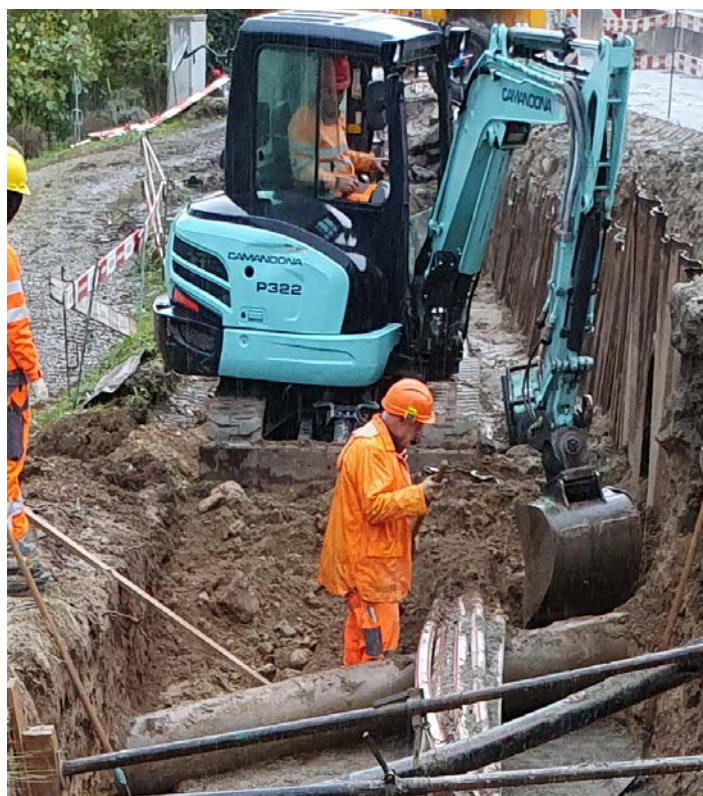
13.11.2023. Travail de précision pour ne pas endommager les conduites qui apparaissent un peu partout.