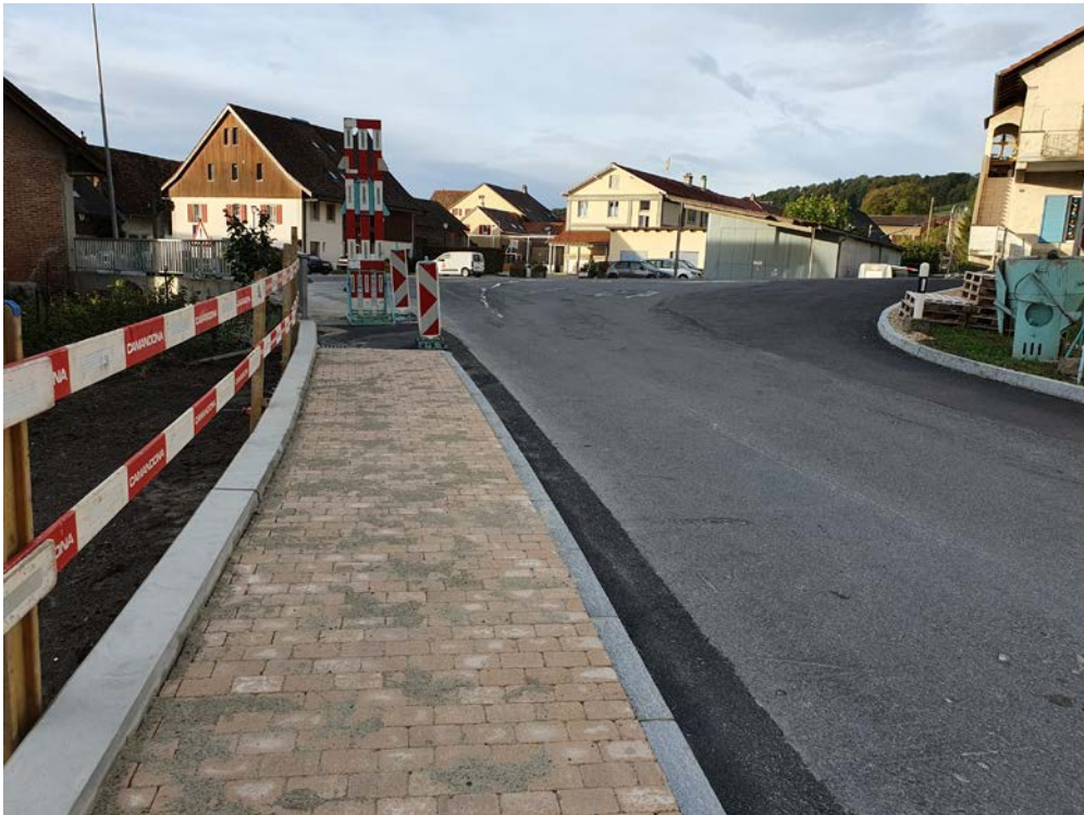
29.10.2023 Le débouché de la route de Fétingny sur la place du Village et le nouveau trottoir en construction

Comme la visibilité est améliorée les services de police veulent remplacer le stop de la route de Fétingny par un "céder le passage". Hum... je vois la situation sur le terrain et non pas sur des plans dans un bureau: vitesse imprévisible de certains véhicules, visibilité masquée par notre auberge communale; la prudence restera de mise.