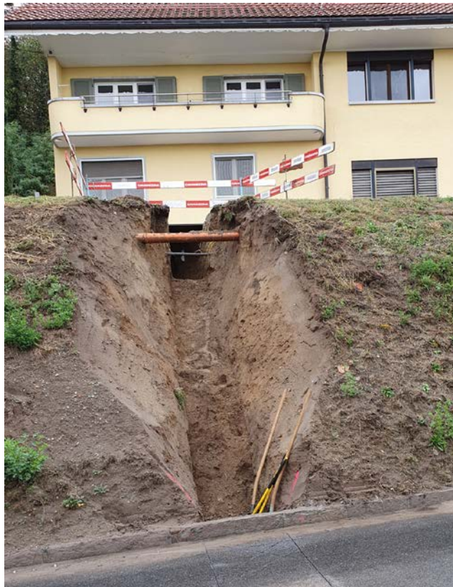
31.10.2023 La tranchée pour l'eau en boucle route de Fétigny – ruelle du Mont

Plus loin on a vu une tranchée grimper vers la ruelle du Mont. C'était nécessaire pour mettre en boucle l'approvisionnement en eau.