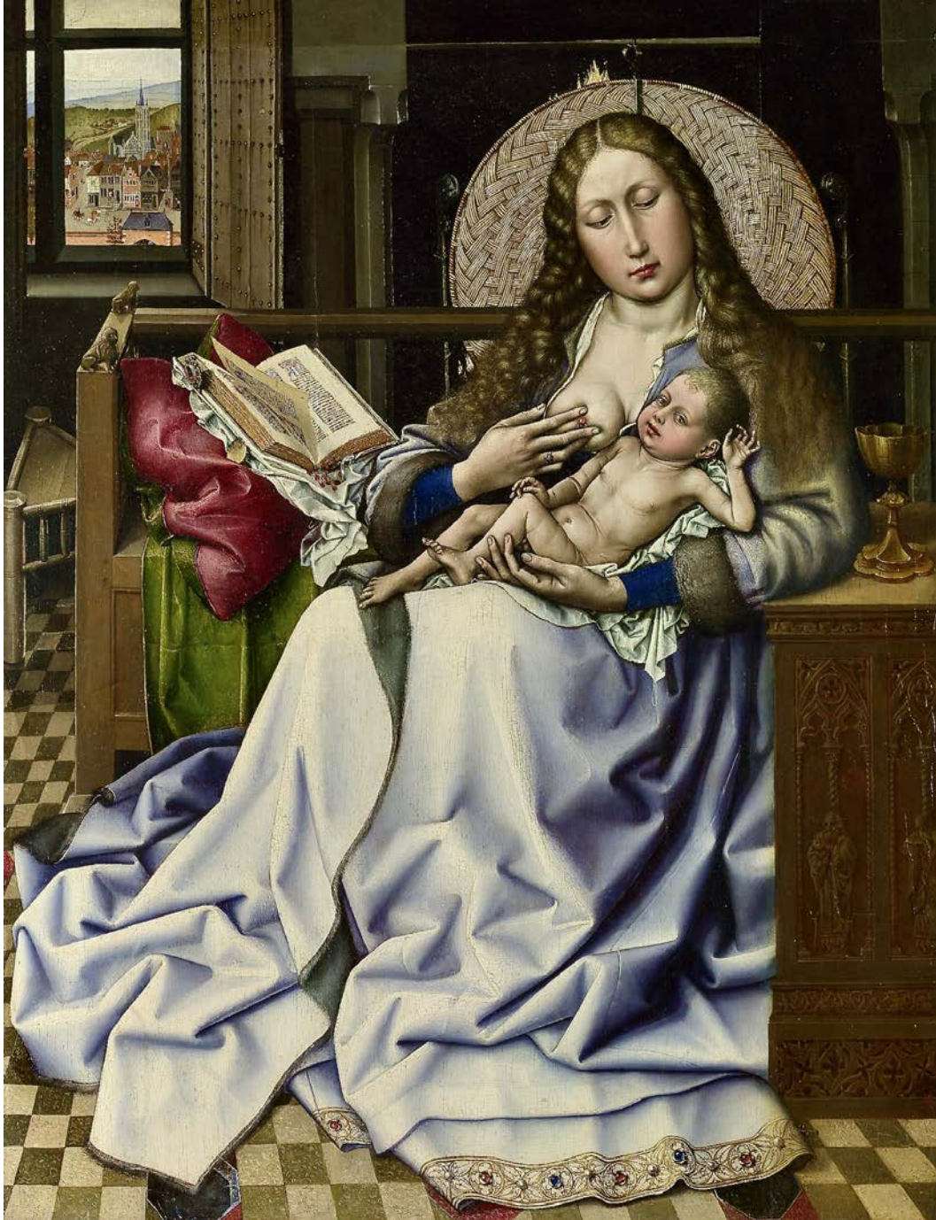
La Vierge et l'enfant Jésus devant un écran d'osier. Attribué à Robert Campin, le Maître de Flémalle (1378-1444), chez lequel la nativité est un thème récurrent. Actuellement à la National Gallery de Londres.

Le Conseil communal de Ménières vous souhaite de bonnes fêtes de Noël et une heureuse nouvelle année.