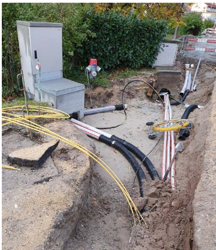
7.11.2023. La nouvelle cabine du Groupe-e.

Actuellement les travaux se déroulent au niveau de l'ancienne cure. La haie vive de forsythias, cognassiers du Japon, lilas, amélanchier, cotinus, etc. a passé à la trappe de même que l'ancien mur de soutènement en calcaire et grès coquiller. Ce qui frappe c'est la quantité de conduites du quartier qui s'entrecroisent à cet endroit: eau potable, épuration, fibre optique, câbles tv, drainages, électricité, éclairage public. Une imposante cabine du Groupe-e a dû être mise en place.