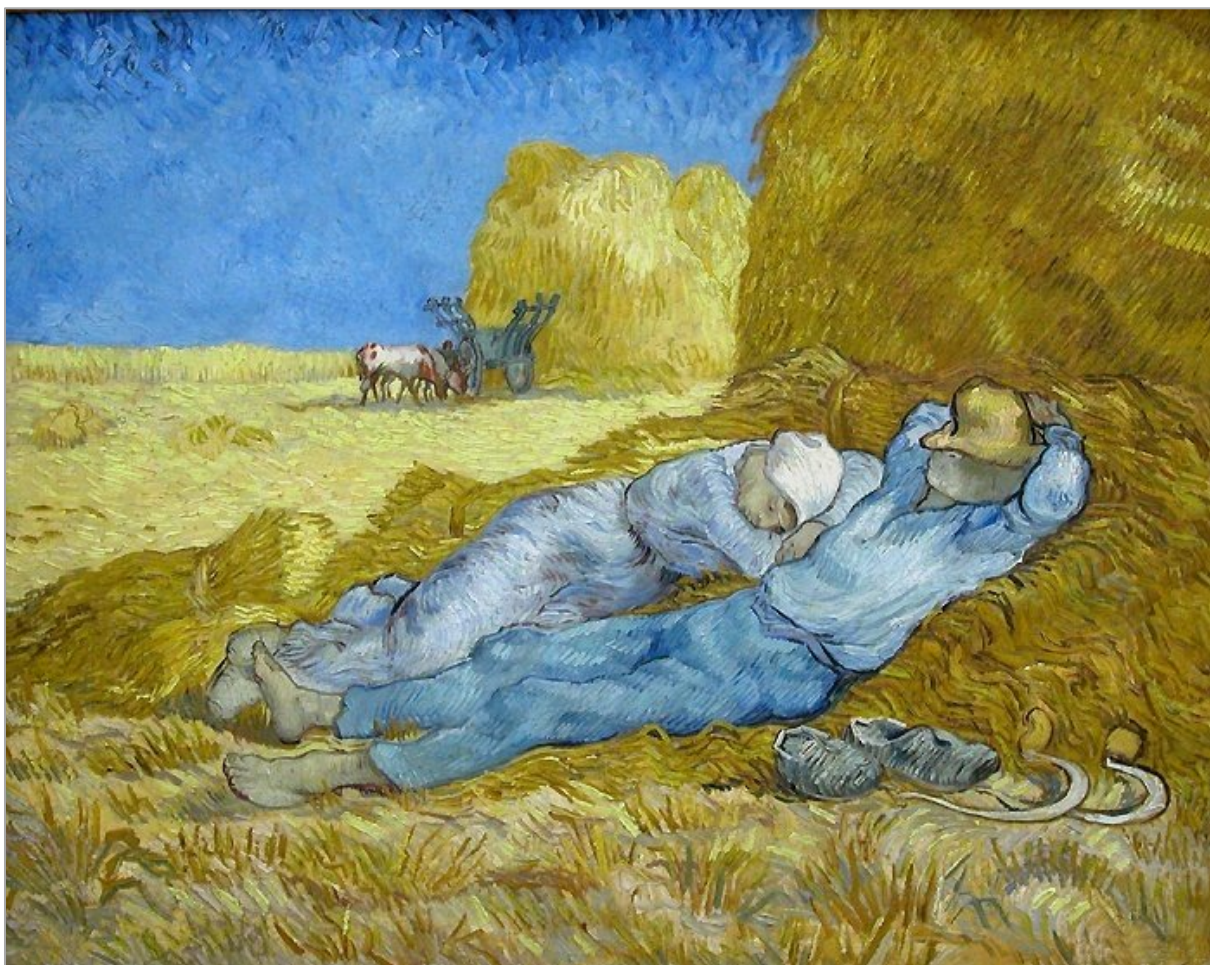
Vincent van Gogh, La Méridienne (1890-1891), Musée d'Orsay (Domaine public)