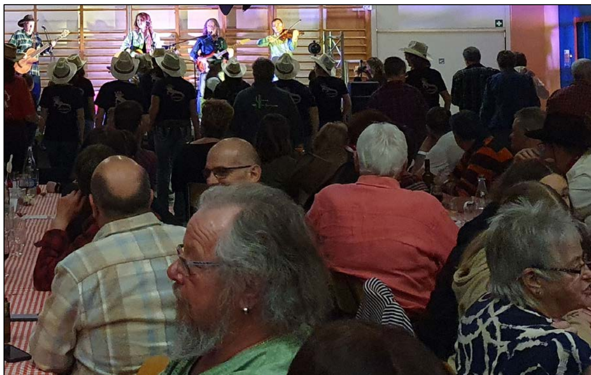
Les Hillbilly Rockers, les danseurs de country, les convives.