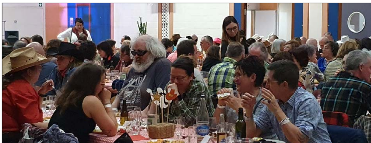
Une partie des 250 participants, bénévoles compris, dans la salle polyvalente de Mènières.