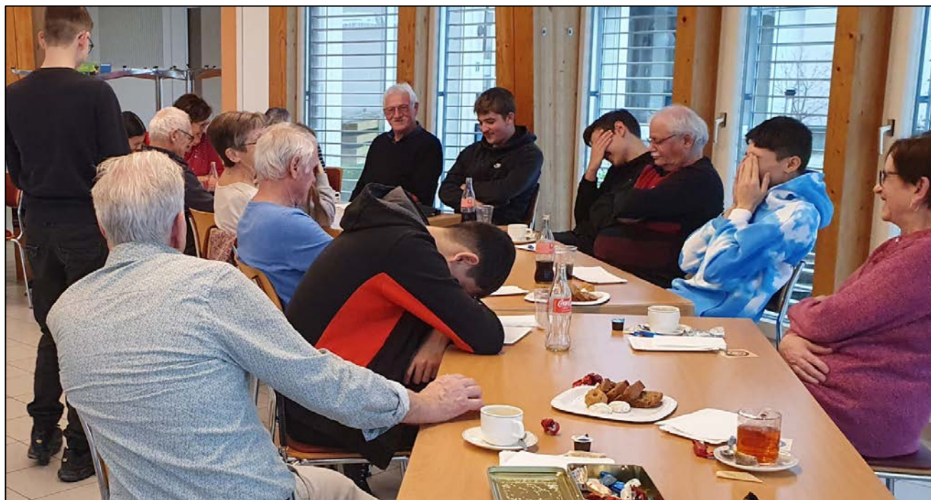
Un épisode du jeu du loup-garou: les villageois sont endormis.

Le 23 décembre 2022 des élèves du C.O. de Cugy et des seniors de Ménières se sont rencontrés à la rotonde de la grande salle pour une cordiale matinée. Boissons, friandises et jeux. Un jeu a eu du succès: le loup-garou . Les loups-garous se font passer pour des villageois. Les villageois tentent de démasquer les loups-garous. Les uns et les autres essaient de s'éliminer. Une voyante et une petite fille essaient prudemment d'aider les villageois.