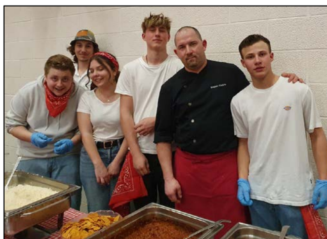
Une partie de l'équipe de cuisine et de service.